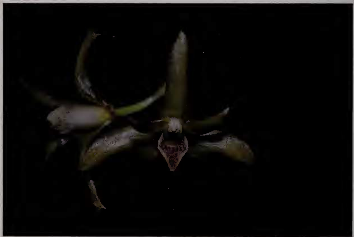
Fig. 1 : Fleur de Xylobium papillosum

Plante très cespiteuse à pseudobulbes coniques, 16-20 cm de longueur, 1,5-1,8 cm de largeur à la base et 0,6 cm à l'apex, bifoliés à l'apex ; feuilles flexueuses, 40 cm de longueur, 7,6 cm de largeur, oblancéolées, apex aigu, avec 5 nervures saillantes en face abaxiale, fortement pétiolées, pétiole long de 5 cm et 0,4 cm de diamètre ; inflorescence allongée, 15-18 cm de longueur, avec 8-15 fleurs espacées le long de l'inflorescence ; bractées florales linéaires, 0,6 cm de longueur ; fleur brillante, à sépales et pétales jaune doux, à labelle orangé ; sépale dorsal oblong lancéolé, apex obliquement aristé, à marges réfléchies, 1,8 cm de longueur, 0,6 cm de largeur à la base ; sépales latéraux falciformes, apex arrondi en vue frontale mais aristé en vue latérale, 1,9 cm de longueur, 0,9 cm de largeur à la base, la région proximale formant un menton avec le pied du gynostème ; pétales obliquement elliptiques, marge supérieure plus arrondie et apex aigu, 1,5 cm de longueur, 0,5 cm de largeur en partie médiane ; labelle distinctement trilobé, lobes latéraux aigus arrondis, lobe médian triangulaire aigu, avec 3 quilles proéminentes en partie basale, texture glandulaire papilleuse, 1,4 cm de longueur, 0,8 cm de largeur en partie médiane ; ovaire linéaire oblancéolé, long de 1,2 cm ; gynostème long de 0,7 cm, avec toute la marge glandulaire dentée et un pied de colonne proéminent de 0,6 cm de longueur. Fig. 1 & 2.